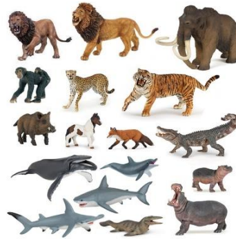
Set de animales plásticos.