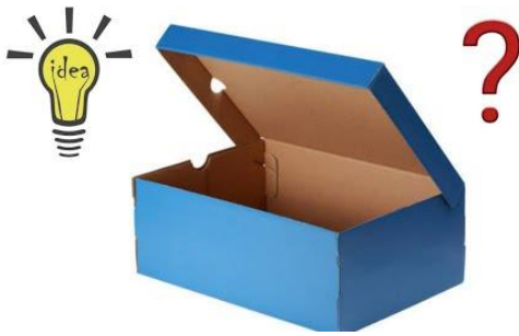
Caja de Zapatos u otra caja.