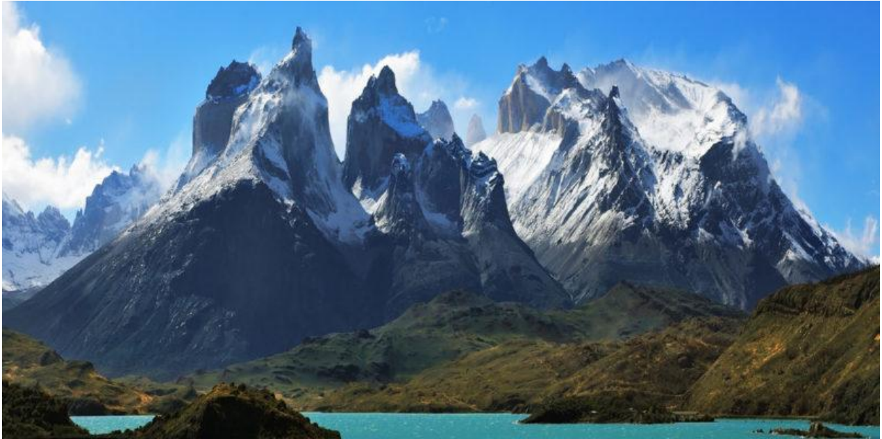
Ilustración 1: Vista, Cordillera de Los Andes, Chile.